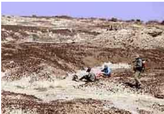
Экспедиция М. Лики в Кении. 2004 год.

Называя такую точку зрения «адаптивистской», Л. Вишняцкий бегло перечисляет существующие на сей счет гипотезы появления двуногости. Все они подразделяются на три группы.