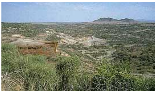
Олдувайское ущелье, огромный тренажерный зал для прямохождения

«При всем разнообразии гипотез, объясняющих появление людей, во главу угла почти неизменно ставятся два события, которые, как считается, имели ключевое значение для начала процесса гоминизации. Эти события - переход части высших обезьян (гоминоидов) от преимущественно древесного образа жизни в лесах к преимущественно наземному существованию в открытых или мозаичных ландшафтах, и освоение ими прямохождения».