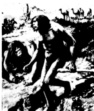
Небрасский человек — реконструкция по зубу свиньи!

В 1891 году голландец Эжен Дюбуа приехал на Яву в поисках "недостающего звена". Там он нашел два черепа, похожих на черепа современного человека, и молчал о них почти 30 лет! Затем он нашел человеческую берцовую кость, а в четырнадцати метрах — затылочную часть черепа обезьяны и несколько зубов. Он сделал вывод, что эти разбросанные фрагменты принадлежали одному существу, и объявил, что наконец обнаружил обезьяночеловека — это существо по сей день называют яванским человеком .